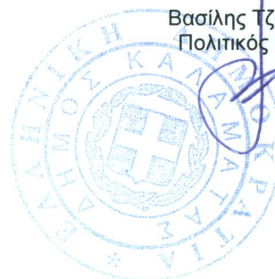
Βασίλης Τζαμουράνης Πολιτικός Μηχανικός