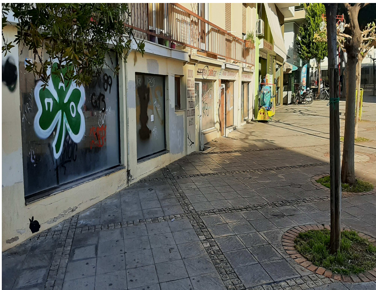
ΦΩΤΟΓΡΑΦΙΑ ΧΩΡΟΥ - Ο.Τ. 530α (ΝΔ άκρο της Πλατείας)