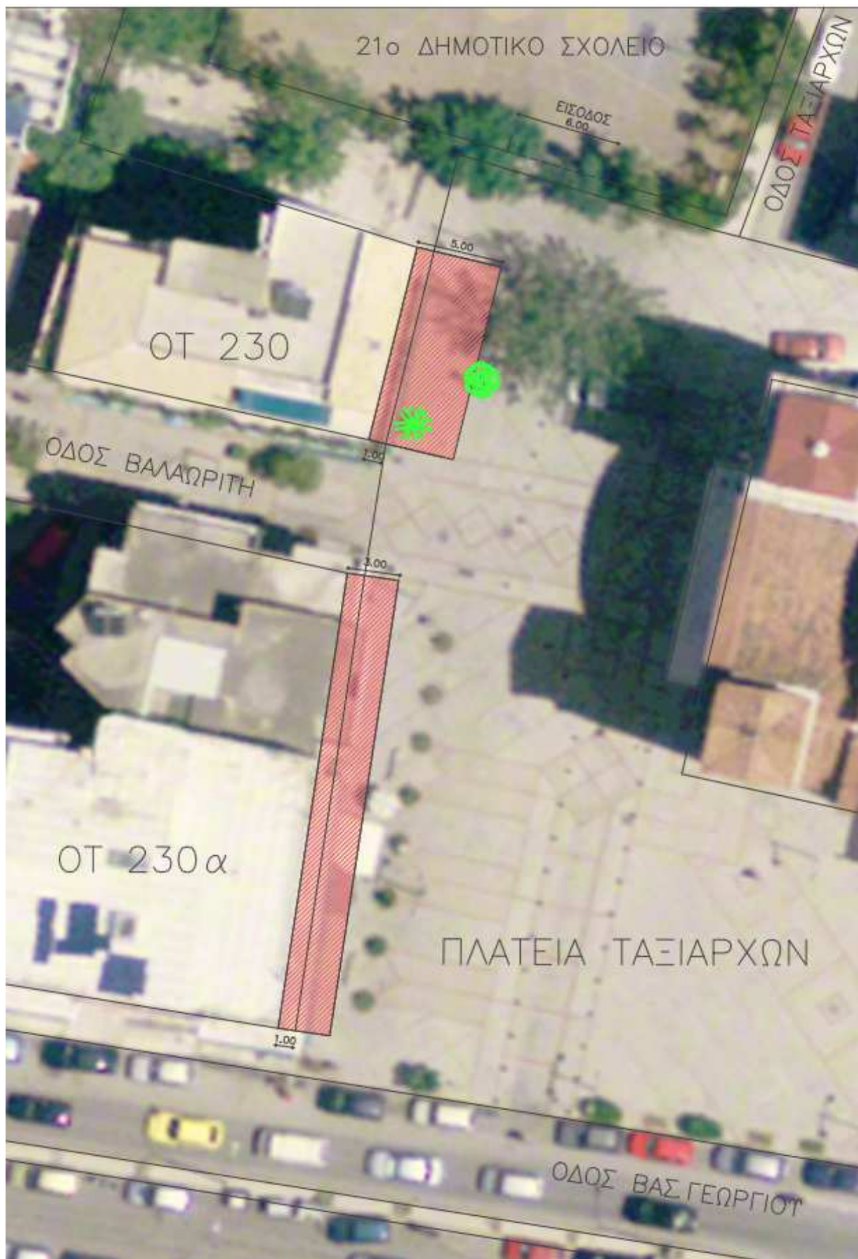
ΚΑΤΟΨΗ ΧΩΡΟΥ - Σχέδιο καθορισμού του χώρου ανάπτυξης τραπεζοκαθισμάτων