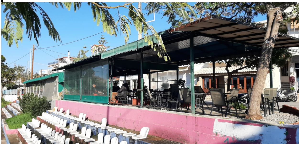
ΦΩΤΟΓΡΑΦΙΑ ΧΩΡΟΥ - Χώρος ανάπτυξης τραπεζοκαθισμάτων (υφιστάμενη κατάσταση)