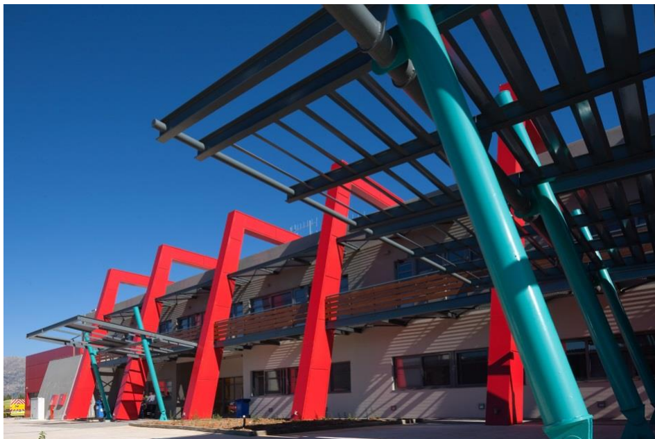
Εικόνα 1: Αποψη του Κέντρου Ελέγχου και Συντήρησης (ΚΕΣ) της ΜΟΡΕΑΣ Α.Ε. στη Νεσπάνη Αρκαδίας (Χ.Θ. 149+400).

Η παρούσα έκθεση αποτελεί συνέχεια των προηγούμενων υποβληθεισών ετήσιων εκθέσεων, καταγράφονται δε σ' αυτή τα στοιχεία που άπτονται της περιβαλλοντικής παρακολούθησης και διαχείρισης του Έργου Παραχώρησης κατά την Περίοδο Λειτουργίας και Συντήρησης του έτους 2020.