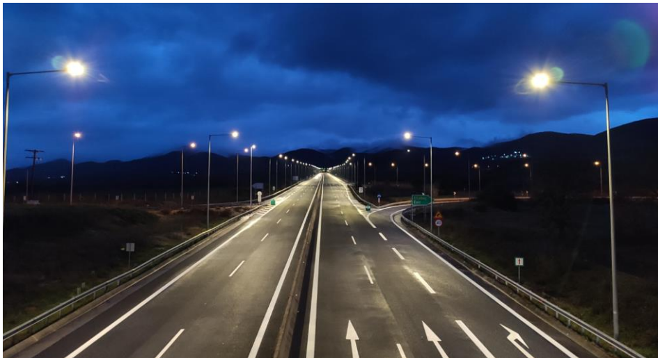
Εικόνα 6: Φωτιστικά σώματα νέας τεχνολογίας, τύπου LED, στο Τμήμα «Cut & Cover Μαλλωτά – Α/Κ Λεύκτρου».

Στο πλαίσιο πληρέστερης και ενιαίας αντιμετώπισης των περιβαλλοντικών και ενεργειακών θεμάτων, η ΜΟΡΕΑΣ Α.Ε. εκτός από το Σύστημα Περιβαλλοντικής Διαχείρισης, εφαρμόζει και Σύστημα Ενεργειακής Διαχείρισης πιστοποιημένο κατά ISO 50001:2018. Η ανάπτυξη, διατήρηση, εφαρμογή και τεκμηριωμένη παρακολούθηση των δύο πιστοποιημένων Συστημάτων, διασφαλίζει τον περιορισμό του περιβαλλοντικού αποτυπώματος της ΜΟΡΕΑΣ Α.Ε. συγχρόνως με την επίτευξη του στόχου διαρκούς βελτίωσης και συμμόρφωσης με τις απαιτήσεις των περιβαλλοντικών αδειοδοτήσεων.