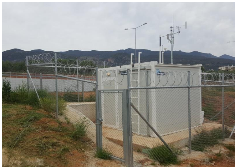
Εικόνα 5: Άποψη του ΜΣΜ Λέικων Μεσσηνίας.

Τα αποτελέσματα των παρακολουθήσεων υποβάλλονται σε τριμηνιαίες εκθέσεις στις αρμόδιες Αρχές.