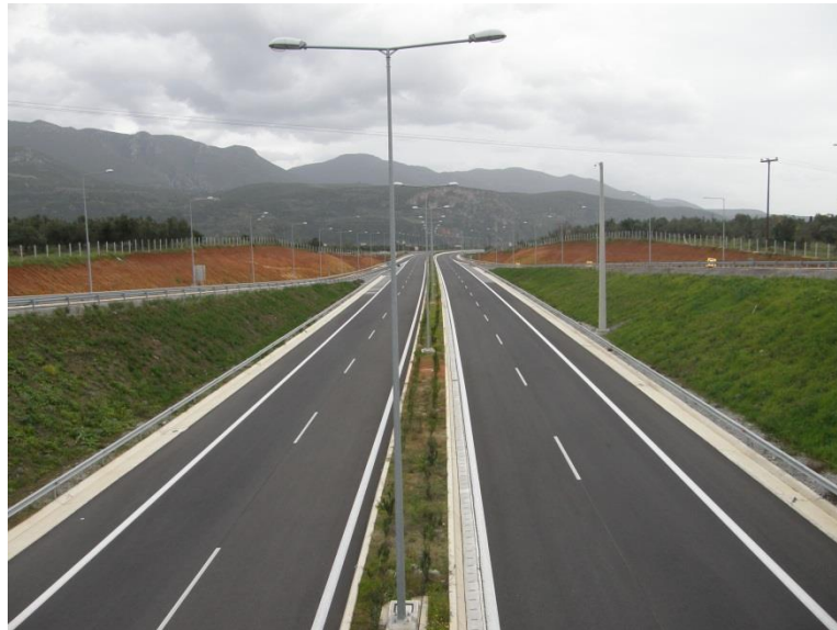
Εικόνα 2: Άποψη των φυτεύσεων της κεντρικής νησίδας και των ερεισμάτων του αυτοκινητόδρομου.

Ο Αυτοκινητόδρομος Κόρινθος - Τρίπολη – Καλαμάτα και Κλάδος Λεύκτρο – Σπάρτη, διαθέτει σε μεγάλο μήκος κεντρική νησίδα πρασίνου, καθώς και πράσινο σε διάφορες θέσεις εκατέρωθεν των οδικών κλάδων (πρανή, ερείσματα κλπ.).