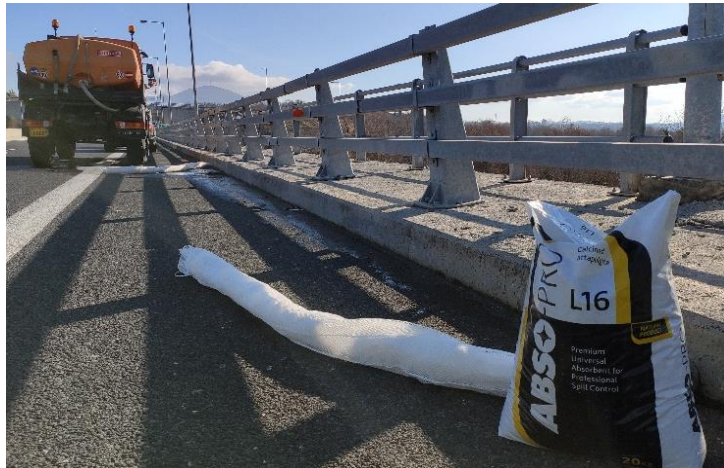
Εικόνα 4: Εικόνα από την Άσκηση Περιβαλλοντικής Ετοιμότητας 2020. Διακρίνονται τα απορροφητικά φράγματα ανάσχεσης ρύπων και η απορροφητική άμμος.

Περαιτέρω, για την αποφυγή πρόκλησης ρύπανσης από τυχόν ατύχημα εντός των σηράγγων του Έργου Παραχώρησης, στις εισόδους αυτών έχουν κατασκευαστεί στεγανές δεξαμενές συγκράτησης ρύπων. Με τον τρόπο αυτό διασφαλίζεται η αποτελεσματική συλλογή τυχόν υγρών αποβλήτων και η αποτροπή διαφυγής τους.