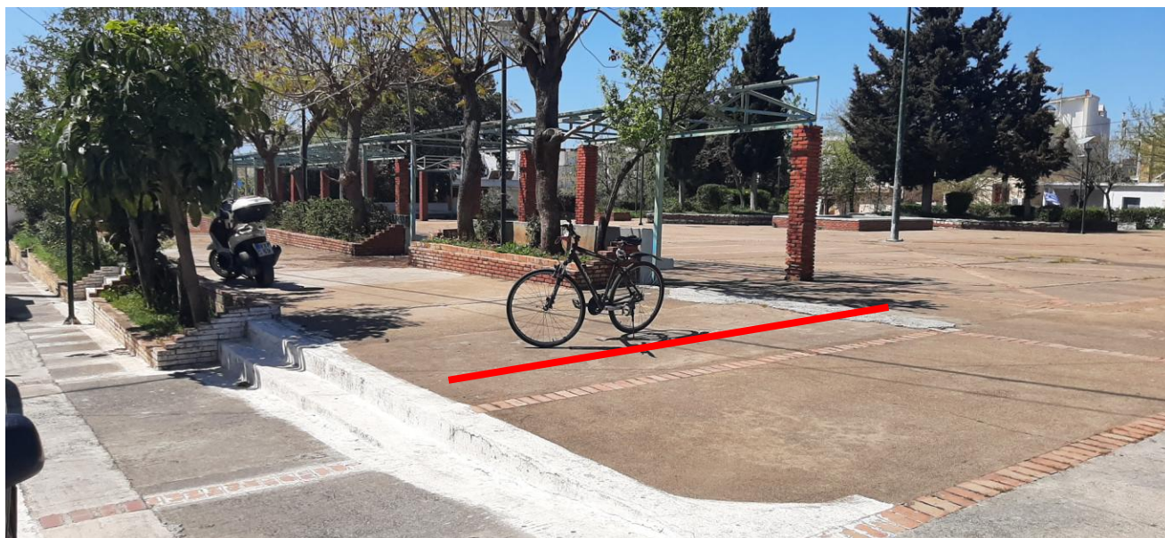
ΦΩΤΟΓΡΑΦΙΑ ΒΟΡΕΙΟΥ ΟΡΙΟΥ ΑΝΑΠΤΥΞΗΣ ΤΡΑΠΕΖΟΚΑΘΙΣΜΑΤΩΝ