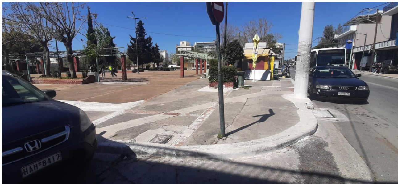
ΦΩΤΟΓΡΑΦΙΑ ΒΔ ΕΙΣΟΔΟΥ ΠΛΑΤΕΙΑΣ (ΟΔΟΣ ΑΘΗΝΩΝ & ΔΗΜΟΚΡΙΤΟΥ)