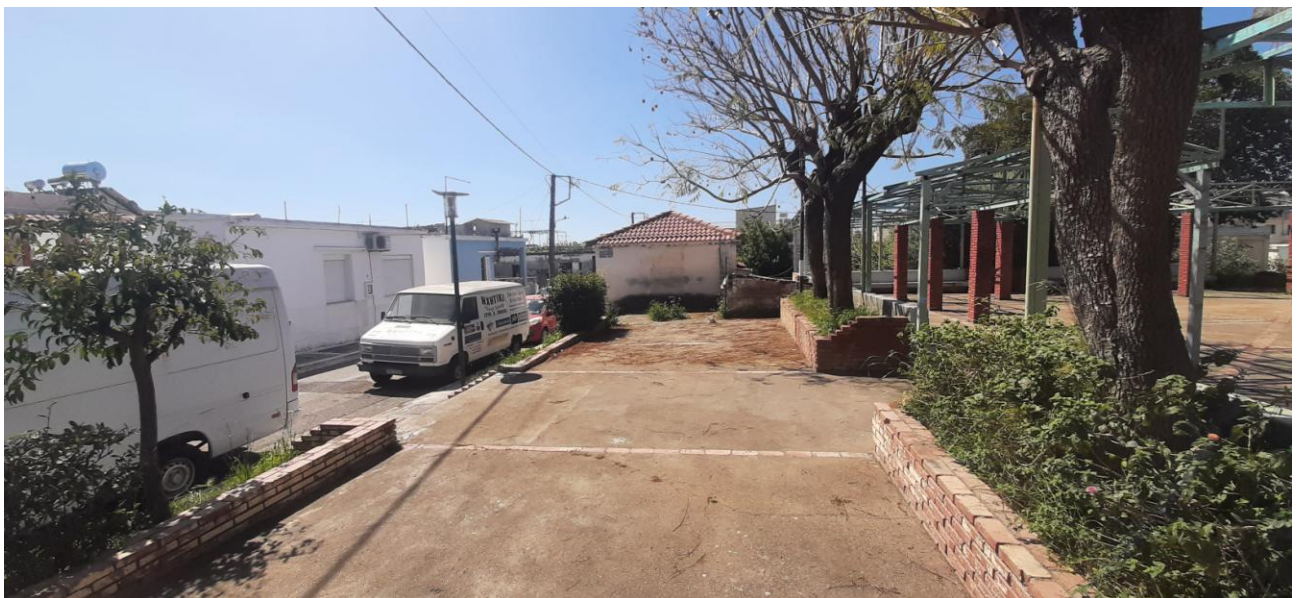
ΦΩΤΟΓΡΑΦΙΑ ΖΩΝΗΣ ΑΝΑΠΤΥΞΗΣ ΤΡΑΠΕΖΟΚΑΘΙΣΜΑΤΩΝ